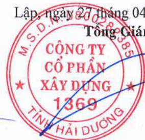
Trần Xuân Bản