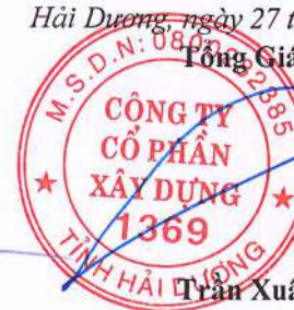
Trần Xuân Bản